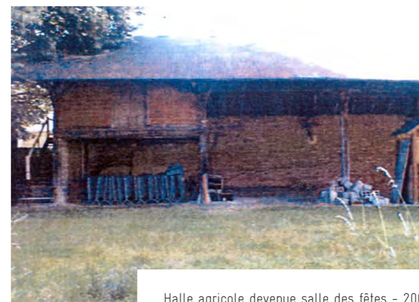
Halle agricole devenue salle des fêtes - 2002