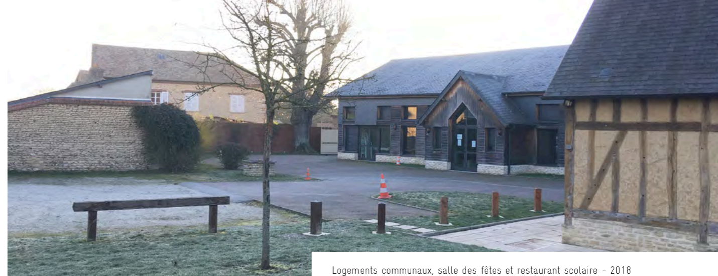
Logements communaux, salle des fêtes et restaurant scolaire - 2018