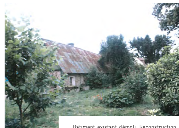
Bâtiment existant démolit. Reconstruction au même endroit du restaurant scolaire - 2002