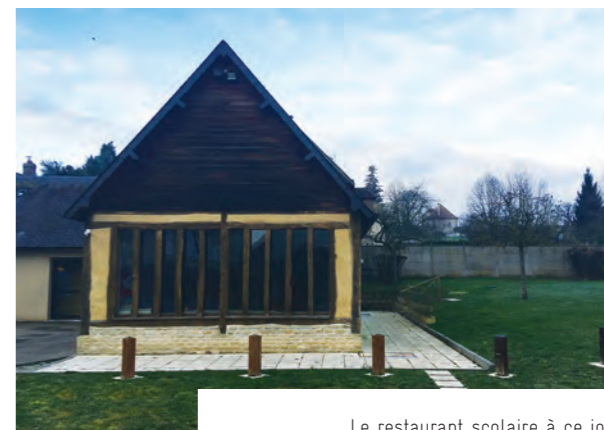
Le restaurant scolaire à ce jour